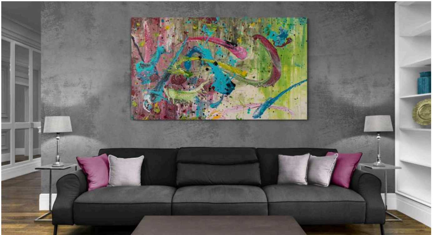
Drachentanz | 100x120cm, Acryl/Lack auf Leinwand, 2020

In diesem Werk steckt pure Lebensfreude. Bunte farbenfrohe „Drachen“ schweben in der Luft, man könnte auch sagen, sie tanzen wild durcheinander und wirbeln im Kreis. Das ganze Szenario erinnert an das chinesische Neujahrsfest, an dem bunte Drachen durch die Lüfte schwingen und es jede Menge Konfetti vom Himmel regnet. Es herrscht eine ausgelassene freudige Stimmung. Durch gemeinsame Aktivitäten schaffen wir ein festes Band der Zusammengehörigkeit.