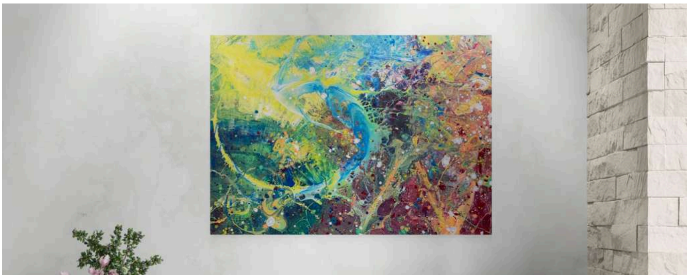
Aufbruch | 100x140cm, Acryl/Lack/Neonfarben auf Leinwand, 2022

Mein Ausdrucksspektrum wurde stetig von mir vorangetrieben.